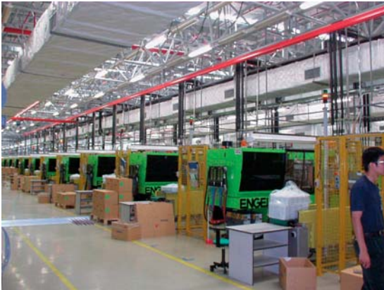
Red de conductos elevados de aire acondicionado en una fábrica.