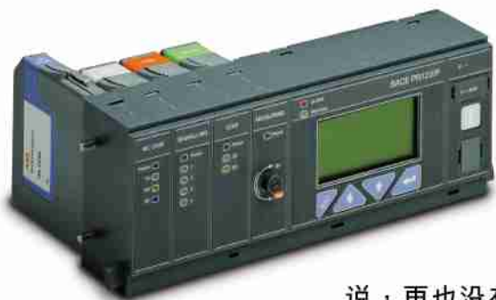
ABB 的最新电子学理论使设计崭新、具有革命性的 PR121、PR122和PR123脱扣器成为可能。基于工程重组硬件结构，使得配置具有灵活性和准确性。对于新Emax来说，再也没有必要更换整个脱扣器来满足客户的要求，只要增加相应的模块便能满足客户的需求：既灵活又人性化。新Emax为你的安装要求提供最方便的解决方案，即使在最复杂的情况下也可如此。