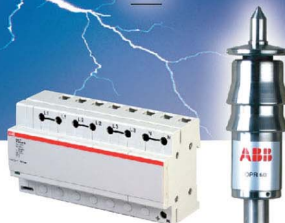
② OVR T1电涌保护器