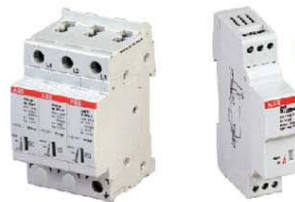
③ OVR T2 电涌保护器