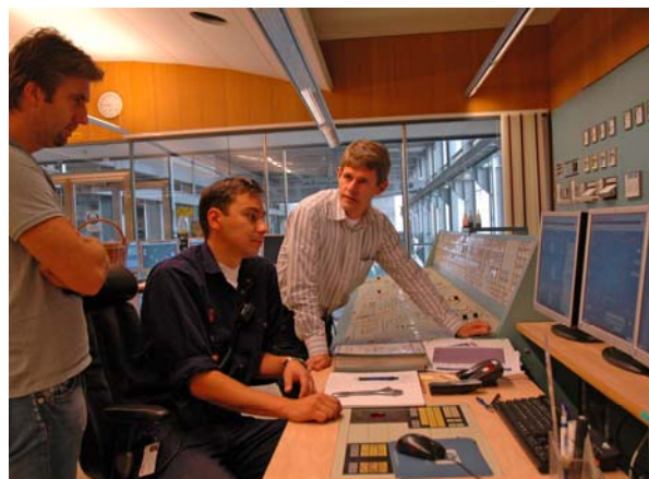
Warte im Heizkraftwerk Örebro