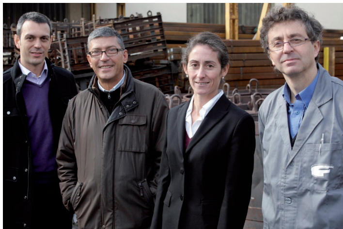
ABB y sus contratos de mantenimiento cumplen con nuestras expectativas

ABB envía para el mantenimiento programado al especialista más adecuado de su equipo de 100 técnicos, aunque parte del trabajo pueda hacerse también a distancia por ordenador o por teléfono.