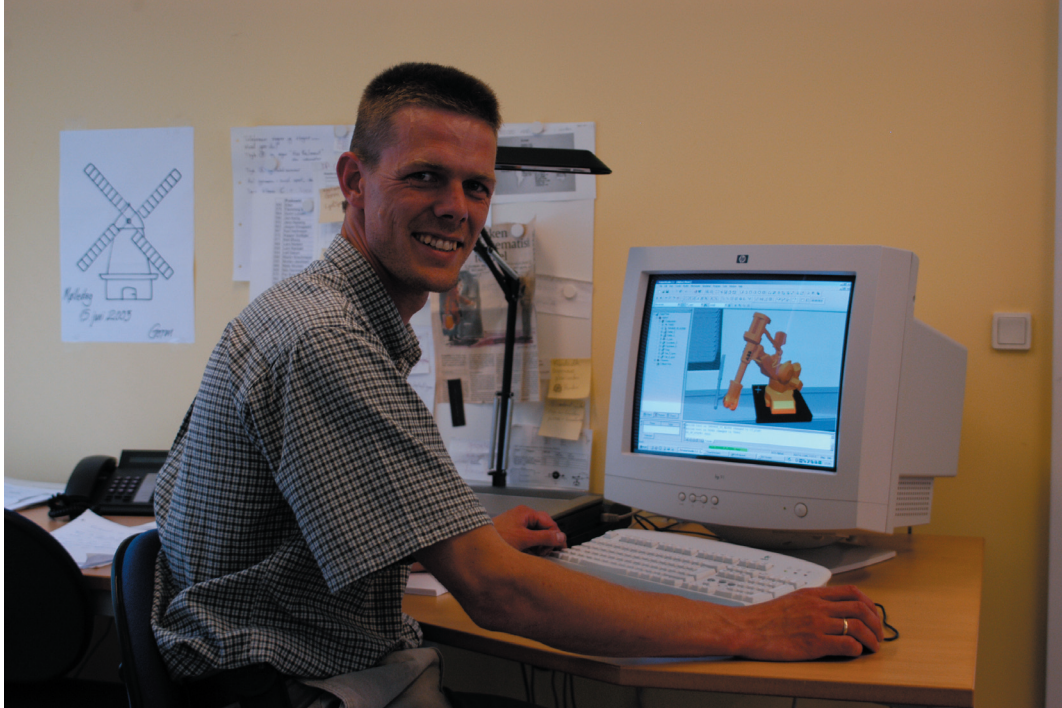
La programmation de robots depuis votre bureau

La société ProInvent A/S, intégrateur de système spécialisé dans l'automatisation des usines, est réputée pour ses ingénieurs d'avant-garde et son approche de la haute technologie. ABB a fait appel à ProInvent pour réaliser une installation chez son client Alpha HPI, fabricant de produits pharmaceutiques.