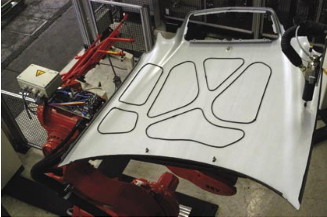
Pegado robotizado de un capó a un Mercedes CLKC208.

Polynorm es un proveedor líder en productos primarios para el sector de la automoción. Las actividades principales de Polynorm son el moldeo con prensa, el montaje y el pintado de componentes de carrocerías, como paneles, puertas y capós, tanto para su montaje en línea como para el servicio posventa.