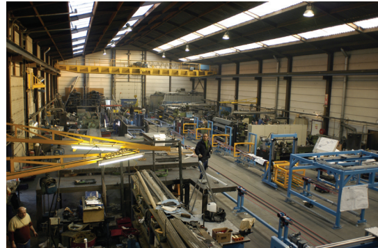
Fertigungshalle bei De Simone.