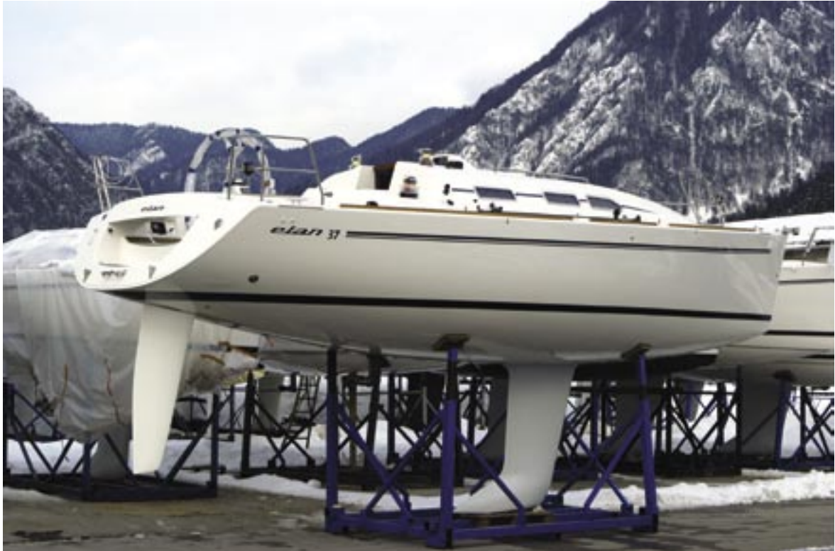
Elan fabrique des voiliers de 10 à 13 mètres de long ; ces embarcations hautes performances répondent à des normes de sécurité élevées.

La société Elan fabrique des bateaux depuis 1949. En 1962, elle intègre l'utilisation de polyester renforcé fibre de verre dans son processus de fabrication. Aujourd'hui, environ 350 voiliers et bateaux à moteur sortent chaque année de ses chantiers.