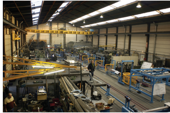
Atelier de montage de la société De Simone.